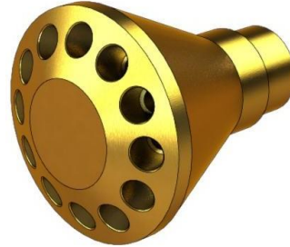
Distribuidor de líquido – Opciones para pedido.